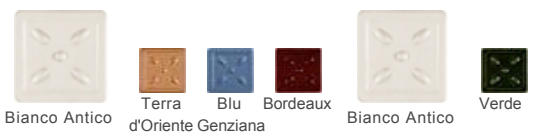
Bianco Antico Terra Blu Bordeaux Bianco Antico Verde d'Oriente Genziana

Stubotto MOM brings together the high gloss effect of hand-made majolica and extremely refined decorations.